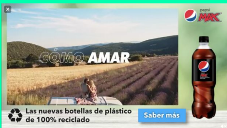
BRANDED PLAYER + QR