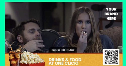
FOOD SERVICE + QR